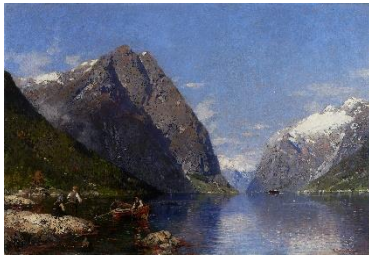
Georg Anton Rasmussen , A Norwegian Fjord in Summer, n.d.