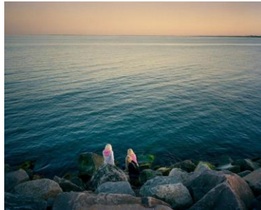
Joakim Eskildsen , Skagen VI, 2008 © Museum Kunst der Westküste