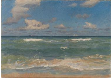
Laurits Tuxen , Fresh Day in June on Skagen, 1908