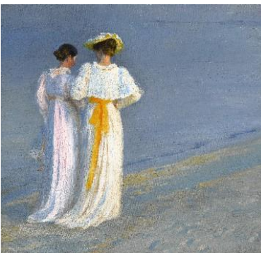
Peder Severin Krøyer, Anna Ancher & Marie Kroyer on the Beach at Skagen, n.d.