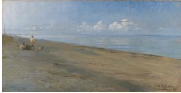
Peder Severin Krøyer , Fishermen on the Beach at Skagen. Mild Summer Evening, 1883